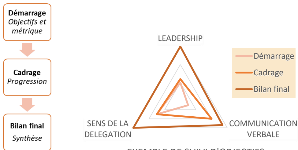
EXEMPLE DE SUIVI D'OBJECTIFS

Nous associons à ceux-ci des indicateurs de succès afin de bénéficier de repères quantitatifs et qualitatifs afin de mesurer l'avancement de vos progrès dans le temps.